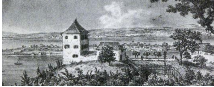
Schloss Sandegg 1830